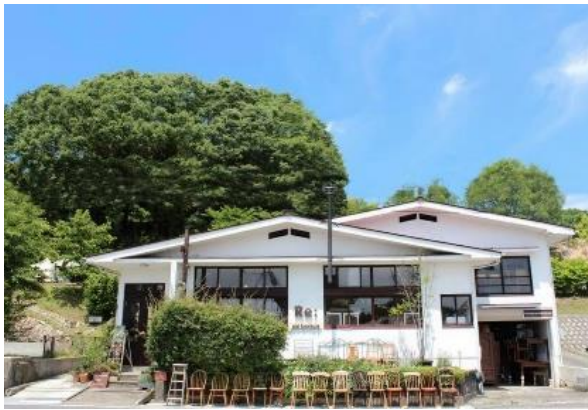
リ・カムアクロス